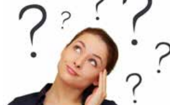
Hoe pakt u de uitdagingen aan? p. 2-3