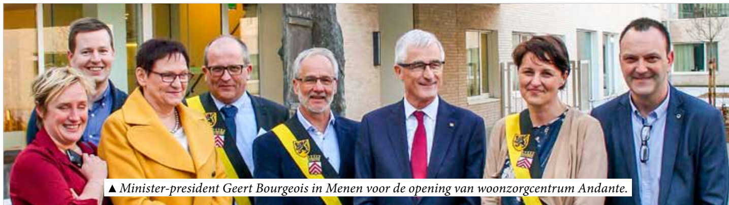
▲ Minister-president Geert Bourgeois in Menen voor de opening van woonzorgcentrum Andante.

V.U.: NIK DE CLERCQ, BUURTWEG 194, 8930 MENEN