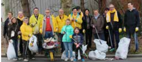
N-VA Menen strijdt tegen zwerfvuil p. 2