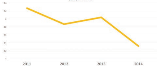
Zwerfvuil per jaar (liter per inwoner)

Stelt men alsnog vast dat er zwerfvuil rond de glasbollen gestort wordt, dan zullen de sluikestorters via een GAS-boete op hun verantwoordelijkheid gewezen worden.